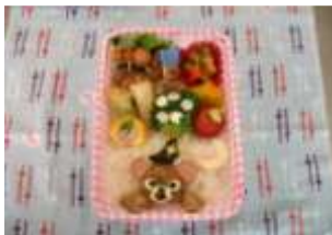
【キャラ弁作りと作品】

◎「ころころくらぶ」は、「親子が気軽に集える場が欲しい」という1人の母親の声から、乳幼児の親子が集う情報交換・交流の場として始まり、現在は毎年50名程の登録がある。人気の親子体操やベビ