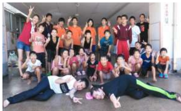
【夏の水遊びでは全身ずぶ濡れに】

また、JLCと子どもたちをつなぐ企画を考え、後輩であるJLCに対しても、意識高く育成活動を行い、自分たちが先輩から受け継いできた独自のノウハウを伝えている。SLCの背中を見てJLCが育っているといえる。SLCの中には青年太鼓(無双太鼓)を立ち上げた者もあり、地区内外で活躍している。親世代になった近年では、子ども太鼓の育成にも力を入れている。