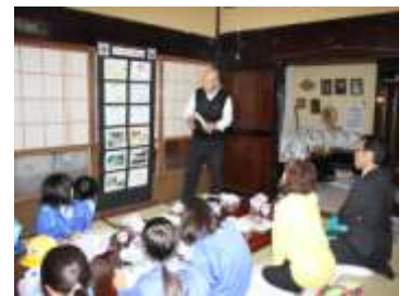
【森本家にて源平合戦の説明】

事業終了後の児童生徒の感想文では、小学生は郷土を知る礎になり、中学生は悠久の歴史を体感できた様子が生き生きと書かれていた。将来を担う児童生徒が地域の歴史を継承し、見聞する大切さをこの事業から学んでいる。