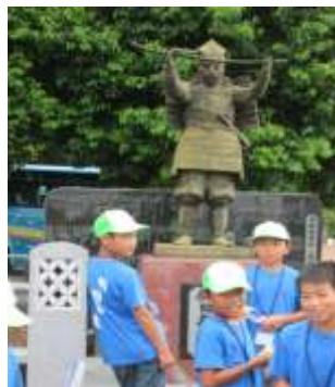
【太田市「新田義貞像」前で】

平成27年度は、明新地区の児童約30名と「明新まちづくり委員会」のメンバーが太田市を訪れ、当地の