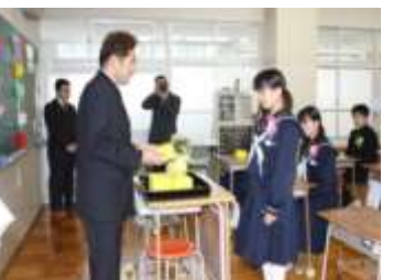
【青和会会員から中学生へ記念品贈呈】

毎年、国見中学校の卒業式後に、「青和会」（22歳から40歳が会員）の役員が、卒業生に「激励」と「記念品」を贈呈する『青和会と中学生との語る会』を開催している。