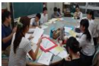
【念入りな打ち合わせ】

中学生・高校生の居場所づくりとして、JLCがある。月一度の例会に加え、夏まつりや敬老会、公民館まつりといった地域事業や、児童や他地区との交流事業などに積極的に参画している。学校生活や家庭では経験できない体験、異年齢・異世代との交流など、様々な経験を積み、たくましく成長している。こういったJLCの活動は20年以上途切れることなく続いている。中高生は勉強や部活に忙しく、フルメンバーがそろうことはなかなかないのが現状であるが、スケッチさん同様、できる時にできる範囲で無理なく楽しく続けてもらっている。地区夏まつりでの段ボール迷路は、まつりの一週間前から組み立て作業を始め、中にはクイズを仕込むといった、時間も労力もかかるものだったが、同じ時間を共有することで、仲間としての意識が高まった。また、終わった後の達成感は次への原動力となっているようである。