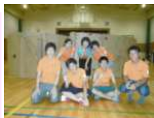
【段ボール迷路の前で】