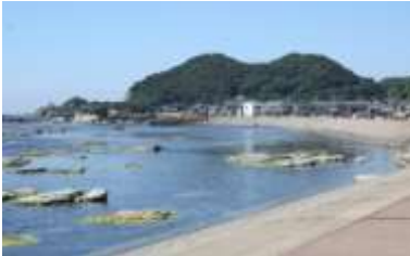
【地区の名所『ブルーシー鮎川』】

国見地区は福井市の西端に位置し、東は国見岳を隔てて本郷、安居地区に連なり、西は国道305号を挟んだ日本海に面している。海の穏やかな時節には漁火や夕日が絶景で、風光明媚な越前加賀国定公園に沿った自然に恵まれた海岸地帯である。また、南は海に沿って越廼地区菜崎町、蒲生町に連なっている。北は鷹巣地区を経て、三国町及び福井市中心部に通じている。