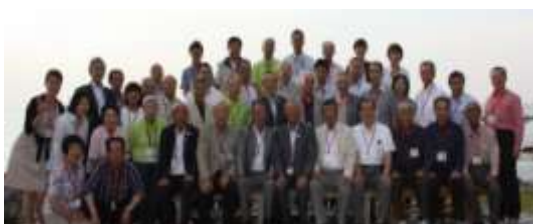
【830年の時を超えた三地区との交流】

古来より国見地区は戦乱の余波もなく平和な集落であり、戦いに敗れた落人を受け入れ定住させた。この史実は、地域の人々の鷹揚な人間性を物語っている。