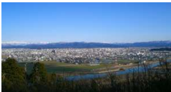
【下市山ミルキングコースからの眺望】

福井市の西部地区、中心部から約4 km 位のところに位置している。大型ショッピングセンターがあるかたわら水田が広がり、地区の西の端には、里山「下市山ミルキングコース」があり、春にはカタクリの花が群生し県内外から多くの人を訪れている。また、地区内には、日野川・足羽川・狐川・底喰川の4つの川があり、山と川・四季折々の野鳥・草花など自然との融合・協調が可能な地区である。