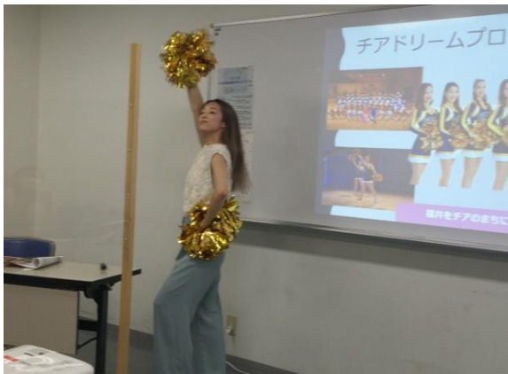
「ふくい若者塾」👉👉◇片岡先生、チアダンス実演中◇笑顔が大事ということで、笑顔なし・笑顔ありで踊った時の違いがよくわかります。◇JETS では一番初めに笑顔の練習をするそうです。