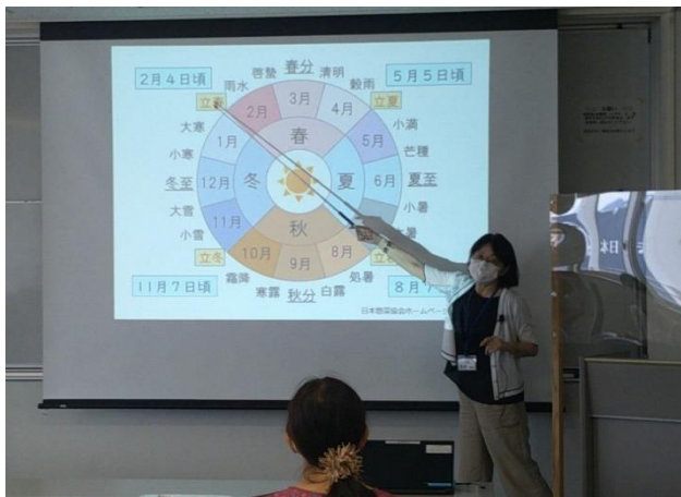
👉👉 「文学講座俳句編」◇二十四節気を解説中。 ◇次回はグループ句会、次々回は「吟行」体験です。