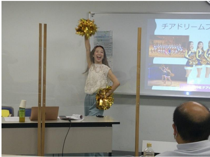
👉👉 お父さん以外のご参加者も絶賛募集中です👉👉