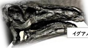
イグアノドン頭骨レプリカ 和泉郷土資料館所蔵

恐竜のなまえについている「ドン」ってどんな意味? 次の中からえらんで、ア・イ・ウ・エで答えよう。